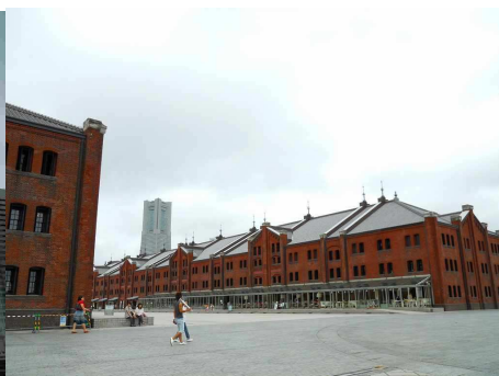
赤レンガ倉庫を横切って